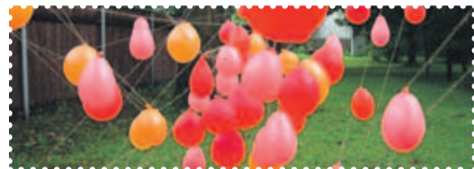
Arbeten av elever vid Riia Pardaugavas musik- och konstskola, "Mesilaste rünnak".

Eksperimenta! är för skolungdomar vad Venedigbiennalen är för den professionella konstvärlden. Hur får vi dagens unga intresserade av samtidskonst? Hur kan man få in samtida konst på skolschemat? Hur lär man ut skapande idag? Denna internationella triennial har som mål att få till bestående förändringar i konstutbildningen för unga i hela Europa. 2011 kommer den till Tallinn. Festivalen har internationellt erkända kuratorer och unga konstnärer från 12 länder som instrueras av konstlärare och vars verk får gå igenom ett grundligt urval. Och givetvis en hel massa unga talanger!